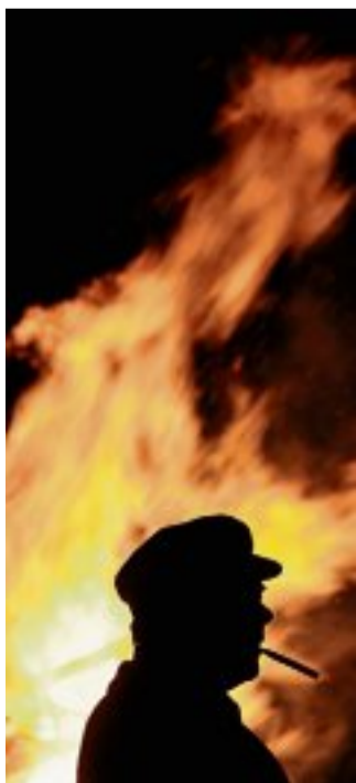
Bundesfeier – mit Höhenfeuer, Reden, Brunch, Musik und viel Folklore.

El Lokal: G. Rag y los Hermanos Patschekos. Folk. 20.20 h.