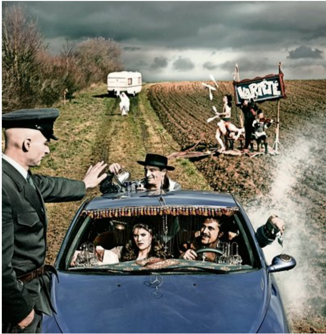
«La Strasse» – mit viel Musik, Akrobatik, Wortwitz und skurrilen Einfällen verzaubert das Broadway-Variété sein Publikum jedes Mal aufs Neue. pd

Luca Botta: Auf «La Strasse» geht es rasant zu und her, mit abgefahrenen Artisten, Musikern und Komikern. Wir erzählen in diesem Jahr die tragikomische Geschichte einer Gauklertruppe, die versucht, gut betuchte Clanmitglieder zu gewinnen, indem sie die Gäste zu potenziellen Heiratskandidaten erklärt und versucht, diese bei jeder Gelegenheit unter die Haube zu bekommen.