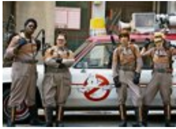
Walt Disney Studios Schweiz