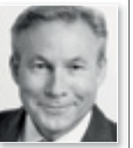
Adrian Amstutz Nationalrat SVP

«Die Rückwirkung der Initiative schafft Unsicherheit und gefährdet Gewerbebetriebe mit ihren Arbeitsplätzen.»