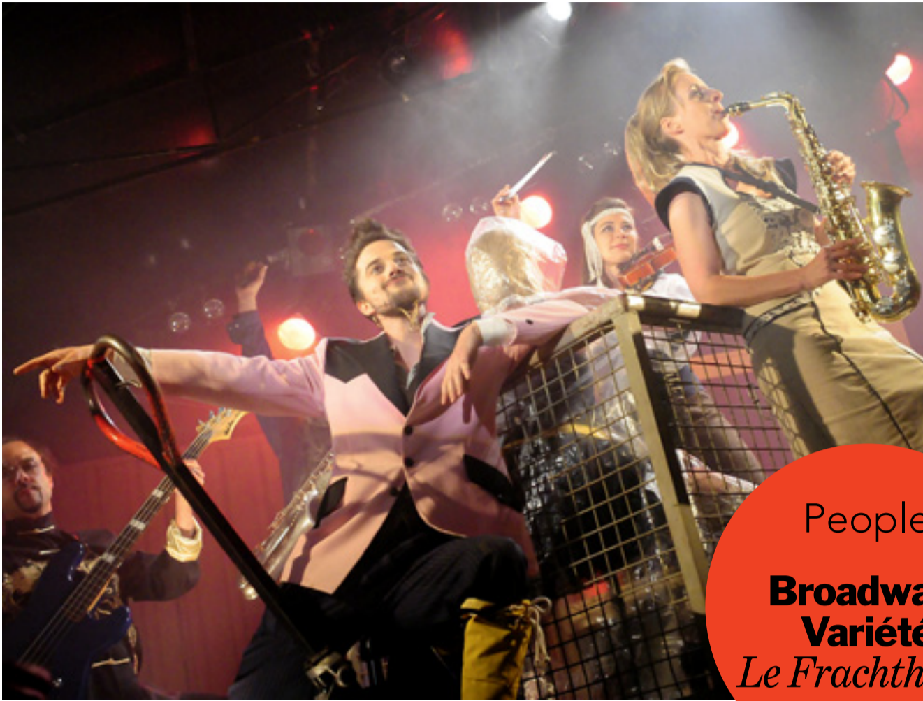
«Ein Schiff wird kommen, und das bringt mir den einen, den ich so lieb wie keinen, und der mich glücklich macht»