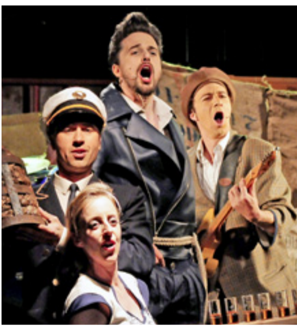
Seemannschor mit weiblichem Farbtupfer